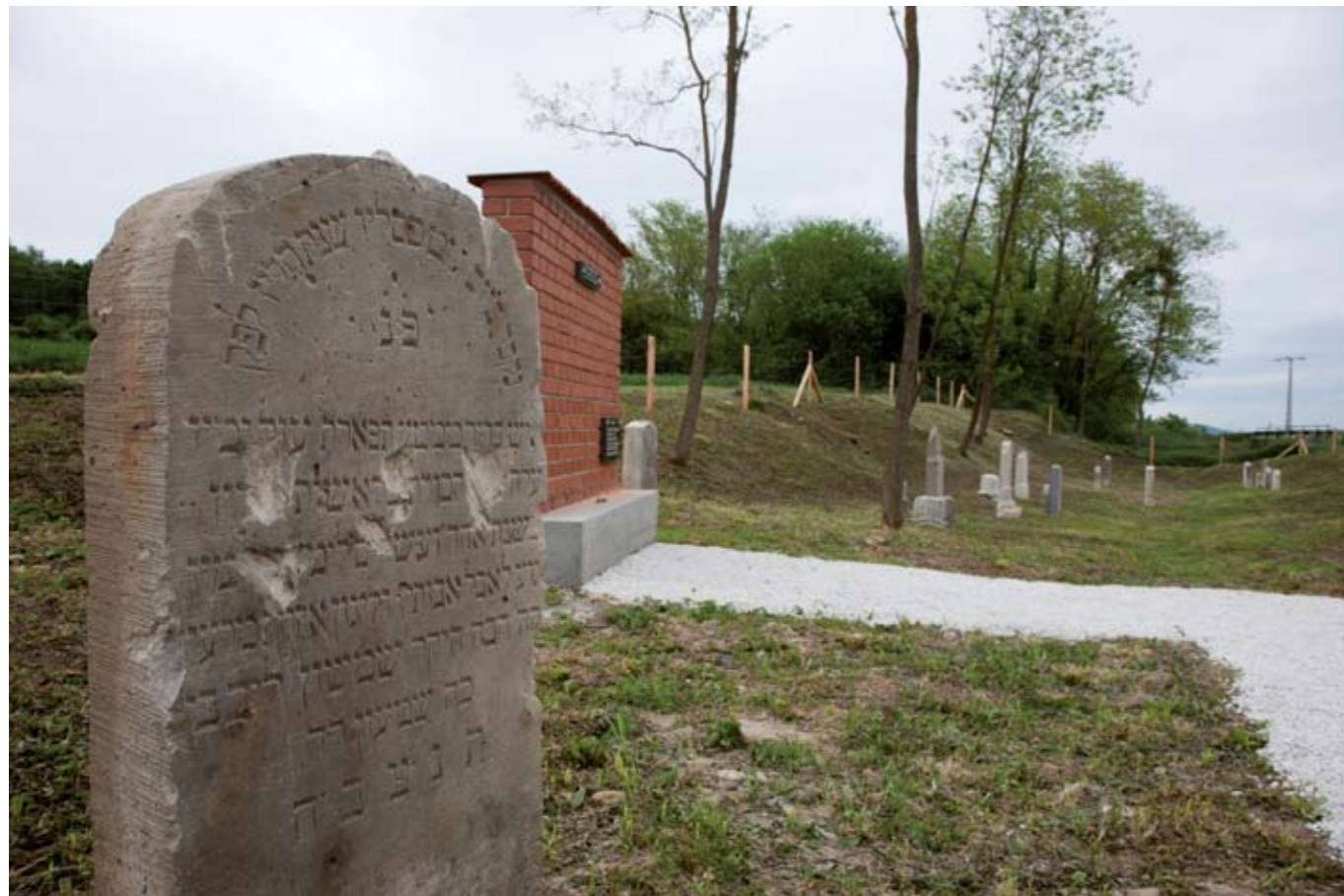
A községbe egy varasdi zsidó temetkezett legelőszőr. A XIX. században 50 főnyi felekezet lakta a falut.