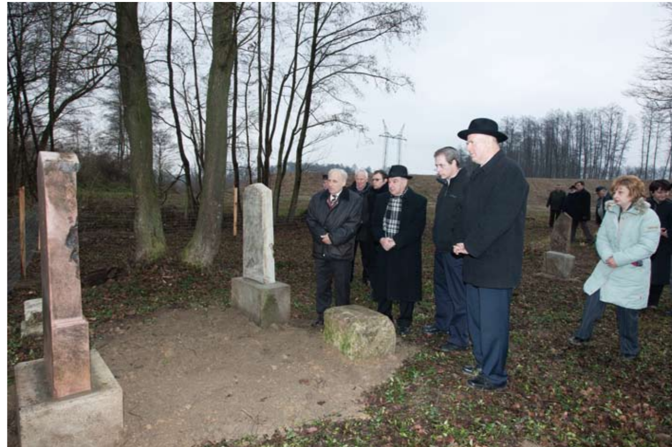
A zsidók falubeli megjelenéséről az első ismert írásos adatunk 1770-ből származik; ez egy zsidó mészárosról tesz említést.