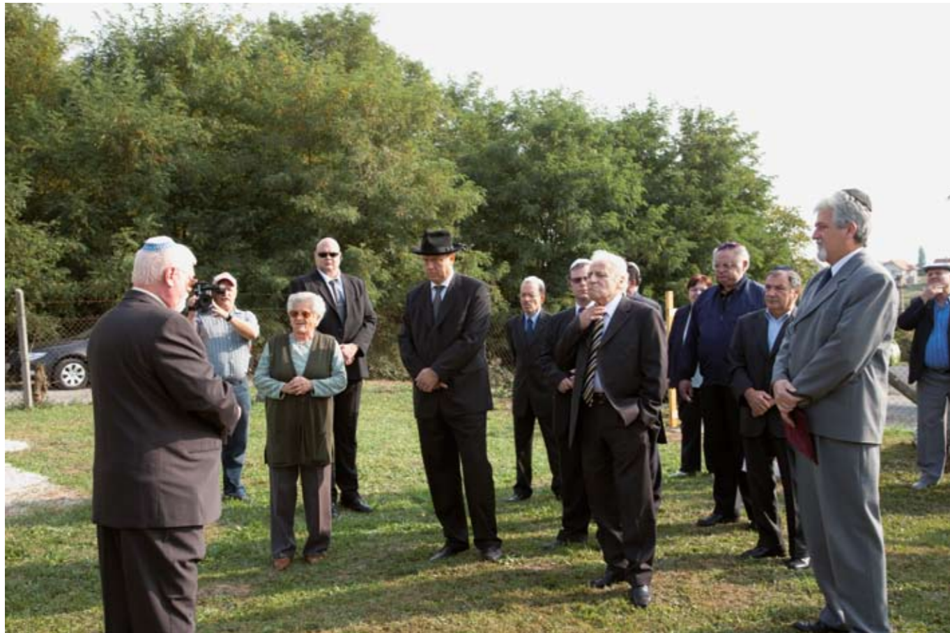
A fontos kereskedelmi utak mentén fekvő nagyközség a 18. század közepétől vonzotta a zsidó betelepülőket. Az 1782-es zsidó-összeírás már kiemeli a zsidóság lövői zsinagógáját.