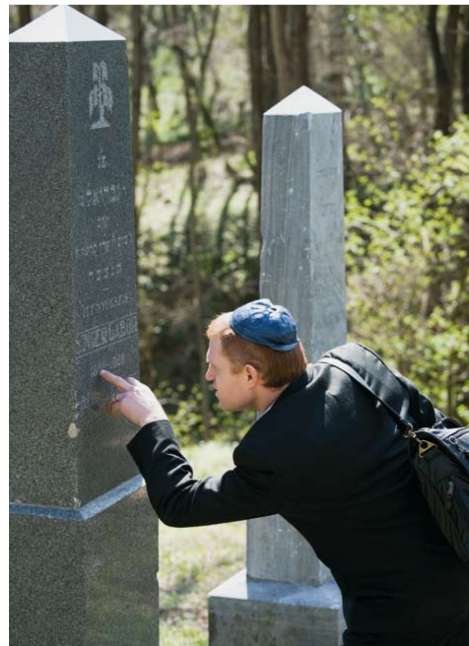
Az 1944. április 8-án kelt zsidóösszeírás a nagykapornaki körjegyzőségben 9 nevet tartalmaz, a jegyzet szerint azonban három Zalaegerszegen tartózkodtak, kettő pedig nem voltak megkülönböztető jelzés viselésére kötelezve.