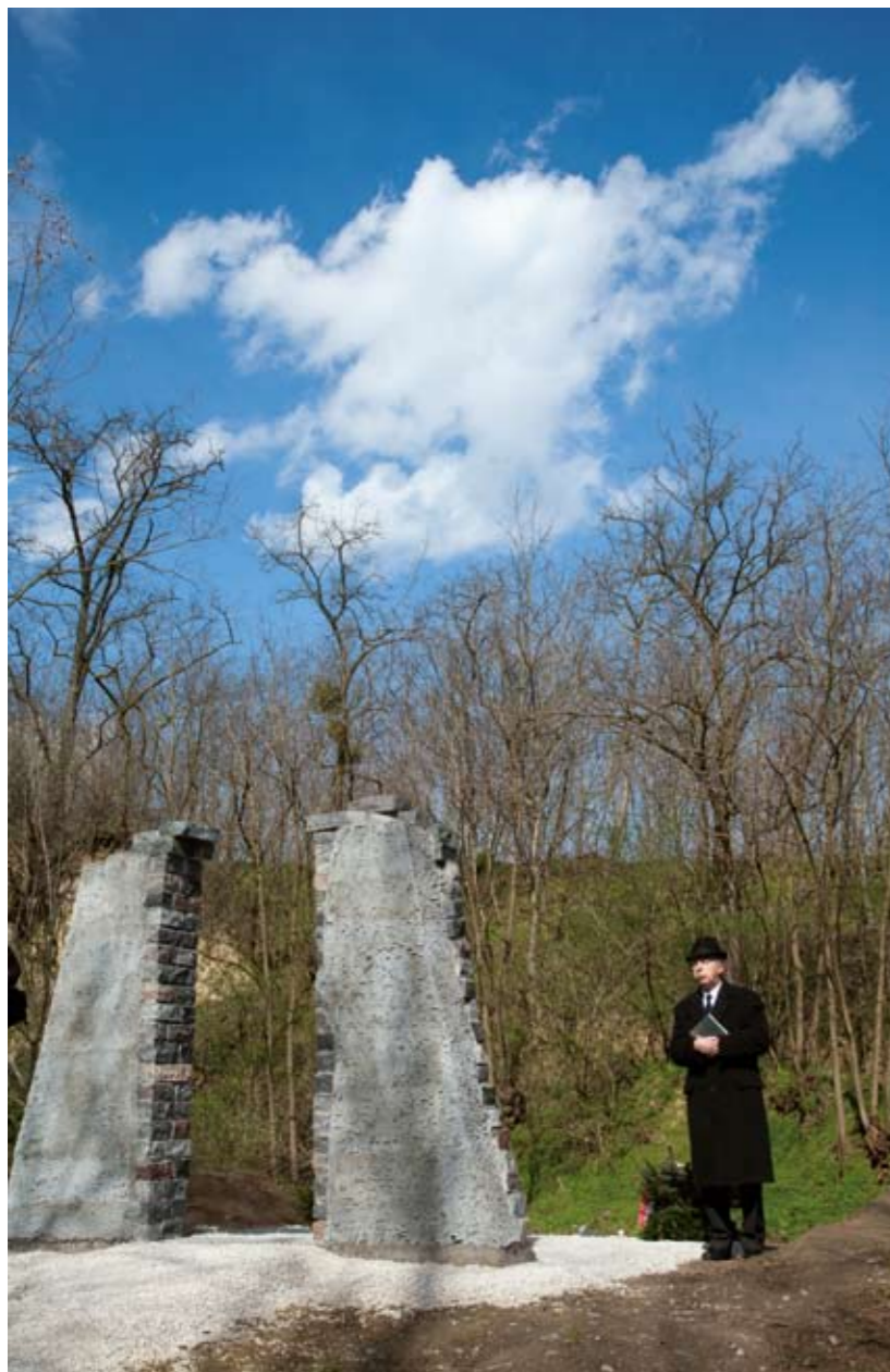
Nagykapornak községben a 18. század végétől laktak zsidók, legtöbbben — 38 fő — 1890-ben. 1941-ben 8 izraelita és 5 zsidónak minősített lakost számoltak össze. A zalaszentgróti gettóba május 15-én öten kerültek, ahonnan június közepén Zalaegerszegre szállították őket.