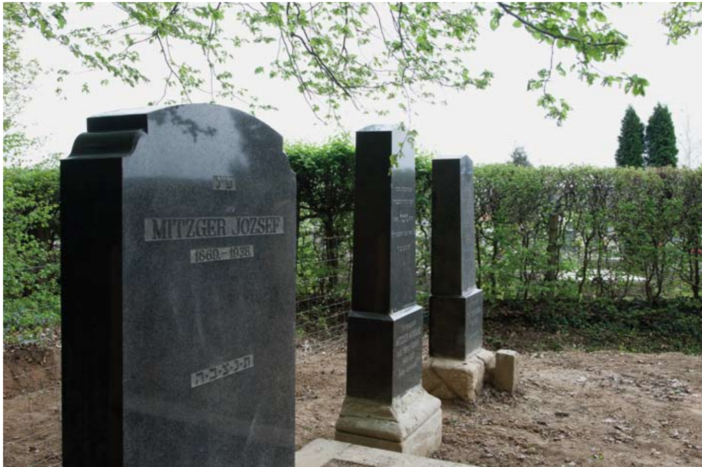
Lentiben az 1800-as évek elején telepedtek meg izraelita felekezetű kereskedők.