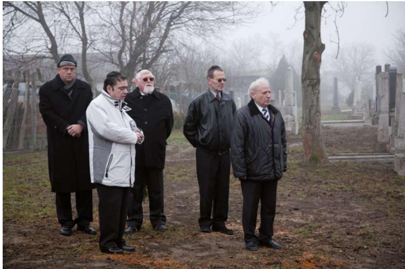
Az első zsidók a 18. század közepén telepedtek le a faluban, a velük rokonszenvező földesúr, Festetics gróf engedélyével, s a század végén már 20 családban 78 zsidó élt a község területén.