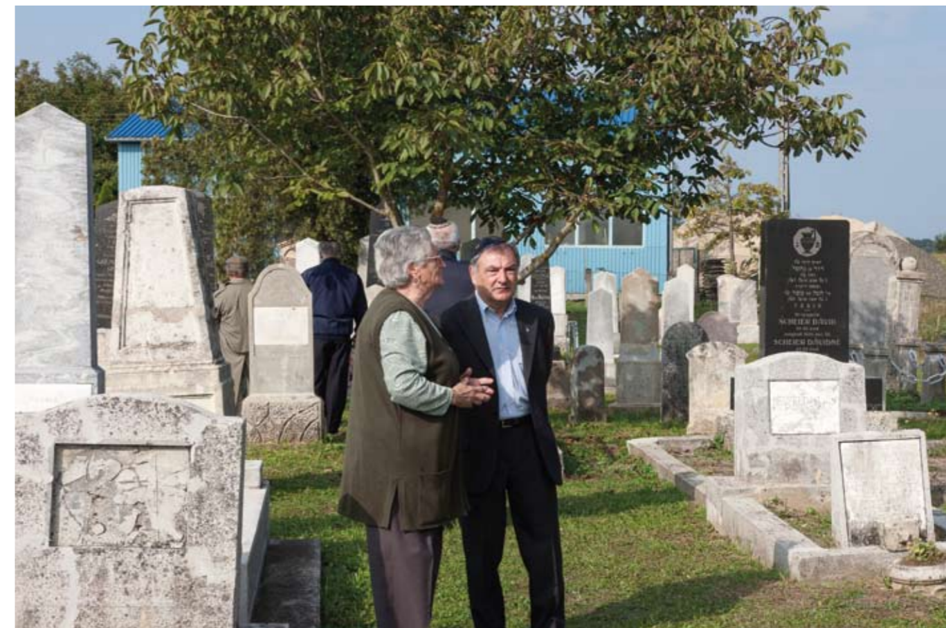
A zalalövőieket több csoportban szállították a zalaegerszegi gettóba, az utolsókat május 16-án vonattal.