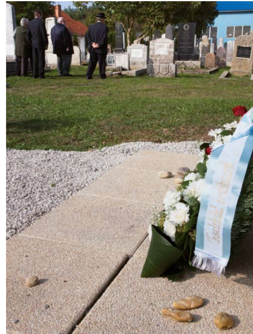
A zsinagógát azóta lebontották. A faluban 1946-ban még 19 zsidó élt.