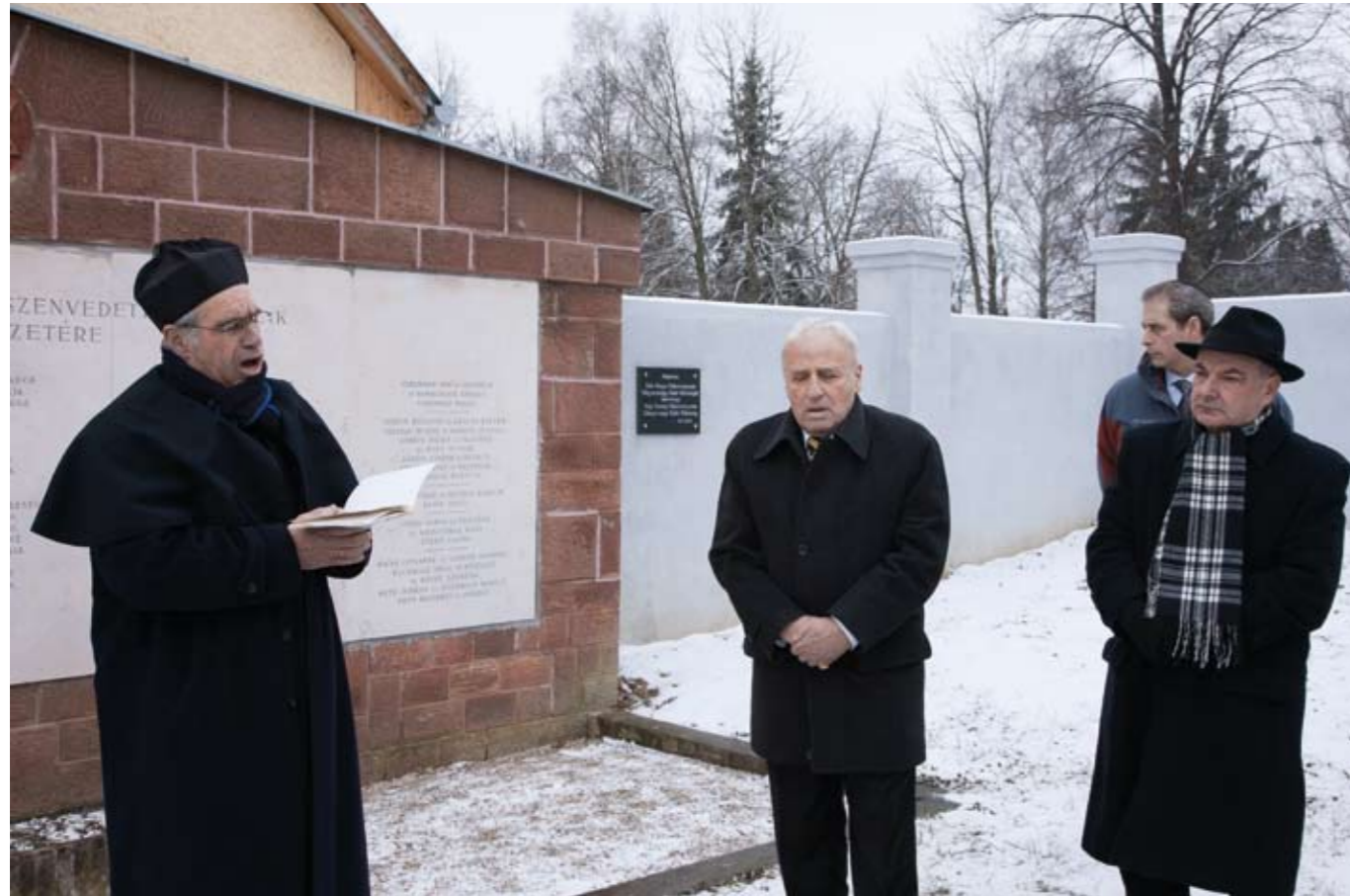
A türjei zsidók száma a helyi népességhez viszonyítva 1880-ban volt a legmagasabb, a legtöbb izraelita pedig 1890-ben élt a helységben: 74 fő.