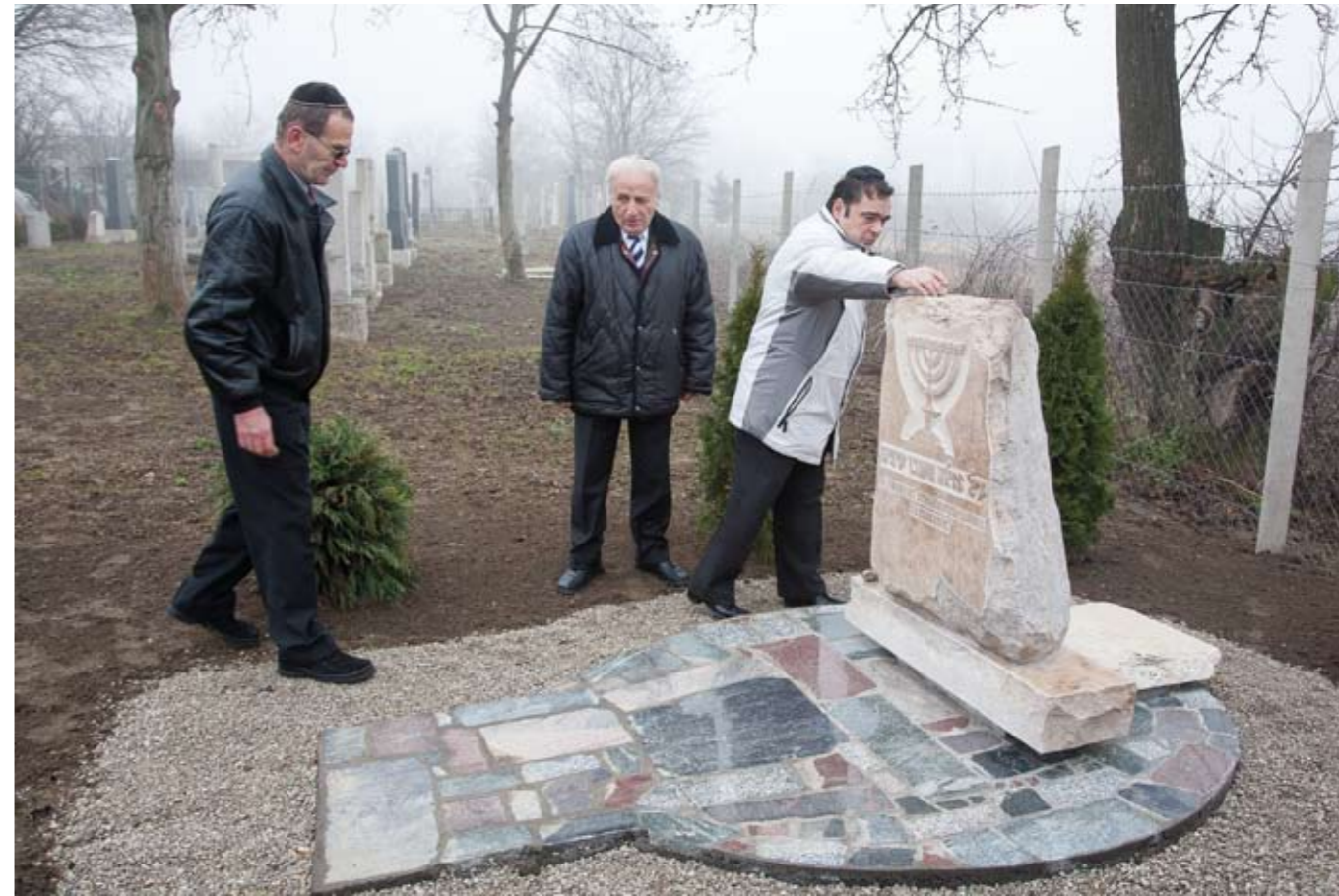
A legtöbb izraelita 1870-ben lakott itt — 195 fő. A közösség 1836-ban már biztosan rendelkezett templommal, ez azonban leégett, akárcsak az 1884-ben épített új zsinagóga. Az utóbbi helyett 1889-ben építettek zsidótemplomot, amelyet azonban mára lebonttak. A hitközség 1858-ban nyitotta meg 1909-ig fennálló népiskoláját.