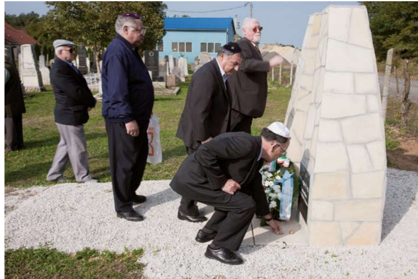
1929-ben a hitközség lélekszáma 305 fő volt, s a tagok anyagi áldozatvállalásával 1930-ban új zsinagóga épült. 1944 áprilisában 191 tagot számolt a hitközség.